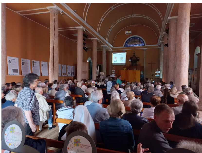
Le temple du Mazet pour le culte autrement du 18 juin