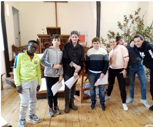
Les marins en répétition