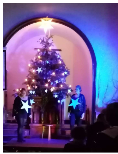
Deux étoiles de Noël