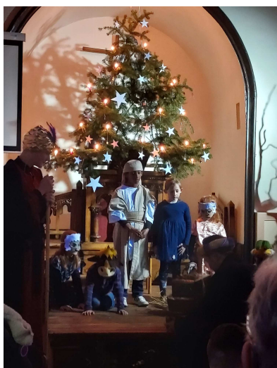
Les enfants autour de la crèche