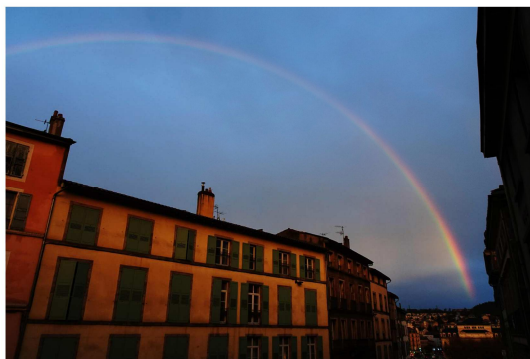
Arc en ciel au dessus du Puy