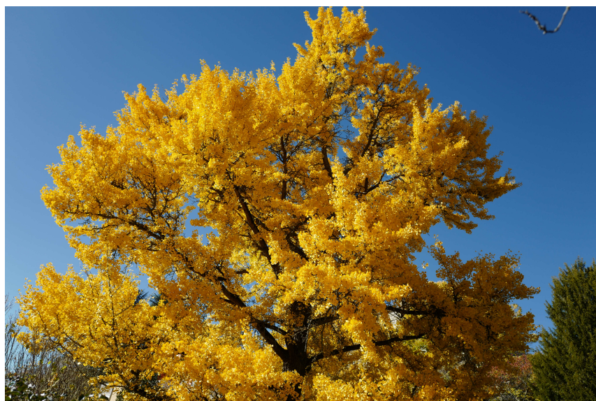
Le Ginkgo, lui, a mis son habit d'or