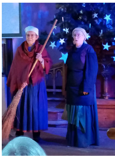
Les servantes d'Abraham