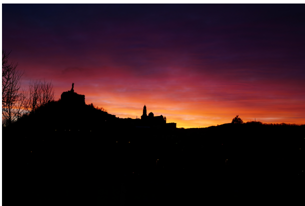
Lever de soleil sur Le Puy

N'hésitez pas à appeler Ariane du Lac au 04 71 03 82 30 si la proposition ne vous convient pas.