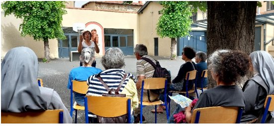
Dans la cour du collège St Régis