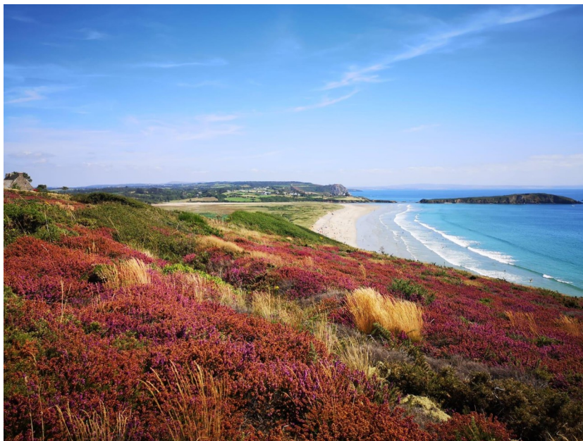
Quelque part en Bretagne cet été