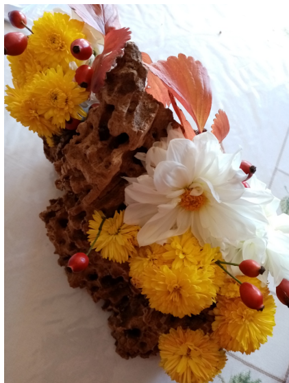
Déco de Georges pour le culte

N'hésitez pas à appeler Ariane du Lac au 04 71 03 82 30 si la proposition ne vous convient pas.